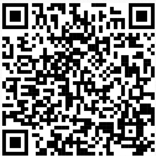
三步呼吸空間 - 應變