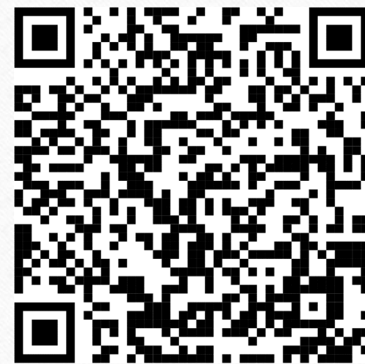
十分鐘靜坐修習（廣東話）