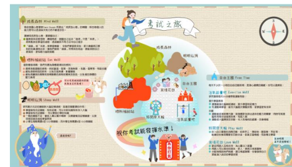
點擊下載網上電版版電子海報 歡迎下載在維多利亞道

我們對自己覺得重要的事情，容易感到有壓力，覺得重要的事情，感到的壓力會更大。其實壓力有好有壞，適量的壓力是好事，促使我們認真對待事情。但如果壓力太大，便會有反效果，可能會出現拖延或逃避行為、身心疲乏（例如：覺得不眠）及失眠等，影響考試發揮表現，令成績減低。因此，考試期間要好好調整及照顧自己，同學可以參考「考試之旅」資源為本抗壓指南中的方法，保持良好的精神健康。如有需要，可向學校的輔導老師或社工尋求協助。